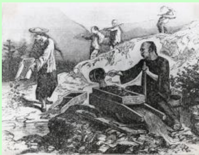
加州中國農民掃描