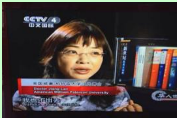
(Cont'd to Page 3)