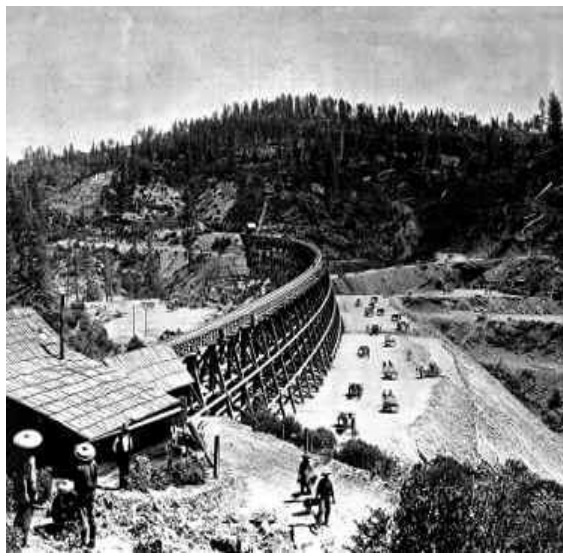
中國鐵路工人運送泥土來填補這個在內華達山脈的 Secrettown 棧橋。